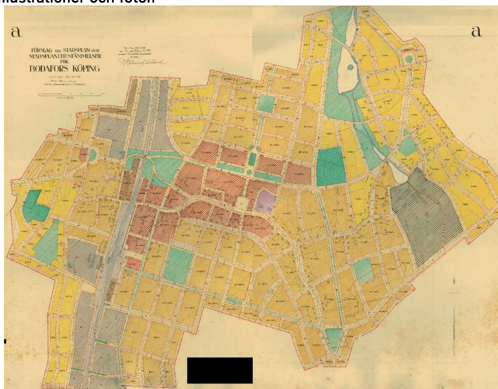
Stadsplanen för Bodafors köping från 1932.