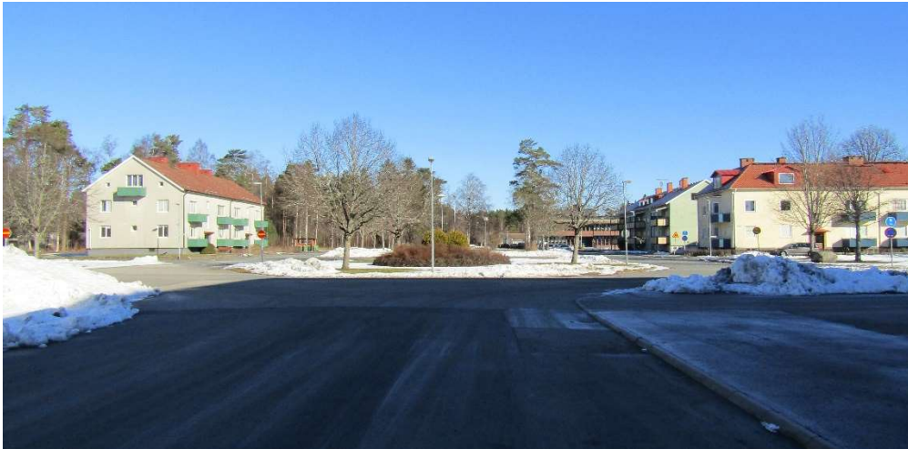
Utblick från Torggatan med torget i ryggen. Torggatan är bred med rester av en allé längs ena sidan och leder fram till det tydligt gestaltade området med en centralt förlagd rundel.