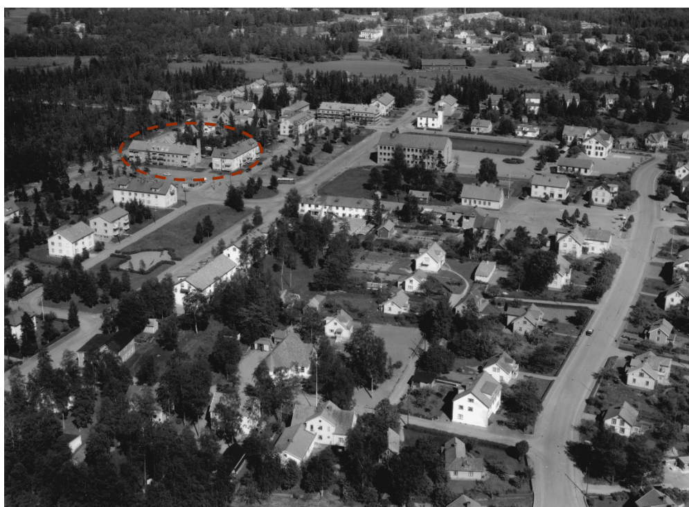
Flygfoto över centrala Bodafors från 1957. De aktuella byggnaderna är inringade i bildens övre vänstra del. Här ses hur 1932 års stadsplan har blivit genomförd norr om torget. I bildens övre del skimtar möbelfabrikens disponentvilla, dit Parkgatans sträckning var tänkt att dras.