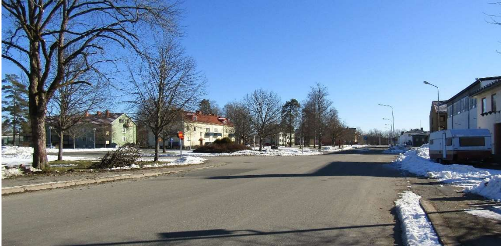
Parkgatan sedd österut. Till vänster ses de två aktuella flerbostadshusen. Gator och kvarter är utlagda efter 1932 års stadsplan. De parallellt liggande Parkgatan och Ljunggatan med ett grönt stråk emellan och även John Zeinwoltsgatan är utformade efter planens esplanadliknande idé.