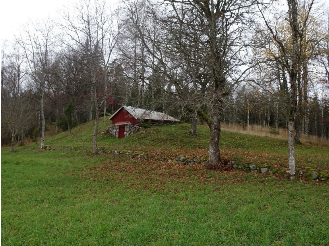
Haraldstorp 1:1, jordkällare.