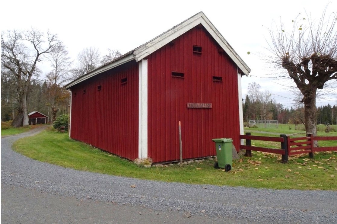
Magasin på Haraldstorp.