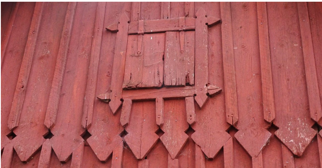
Detalj på uthus på Fällhemmet 1, Havsjö 1:26.