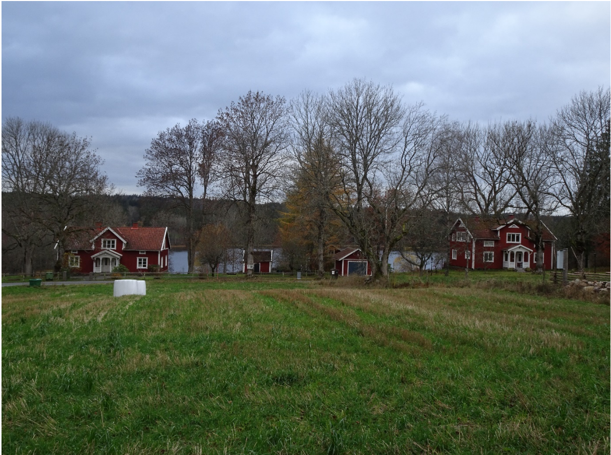
Havsjö by med bostadshusen på fastigheterna 1:10 & 1:18 och den bod i mitten till vänster som visar platsen för var Havsjö säteri låg.

Henrik Mattsson, anställd i konung Johans tjänst, var en av Erik XIV:s fångvaktare under 1570-talet och adlad Silfverhielm av densamme, blev tilldelad platsen för Havsjö säteri som byggdes sent 1500-tal. Säteriet brukades sedan fram till 1810 och huvudbyggnaden stod kvar till tidigt 1900-tal då den revs. Platsen för denna var intill den äldre timrade bod som idag står vid bostadshuset på Havsjö 1:10. Efter att säteriet lades ner och i samband med laga skifte, byggdes många av de gårdar som finns i området idag och de som tidigare låg under säteriet blev egna.