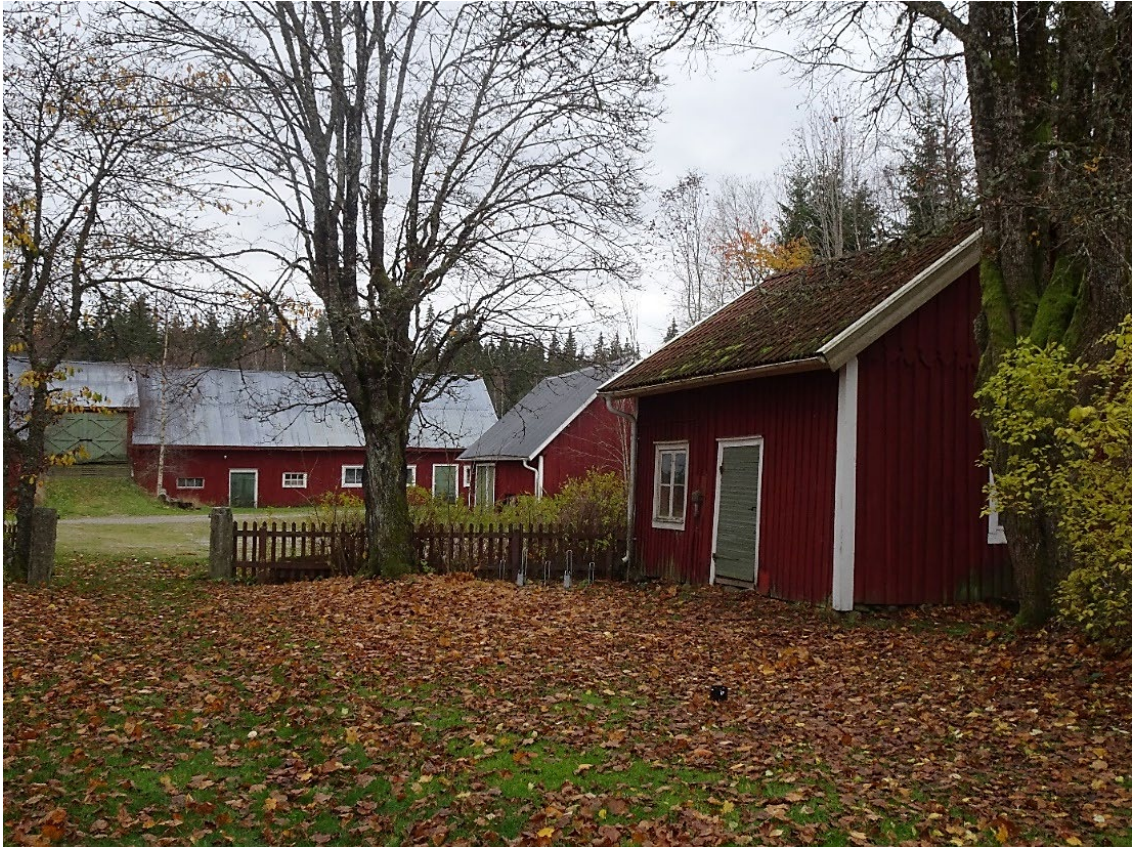
Uthusbyggnader på Fällhemmet 1, Havsjö 1:26.