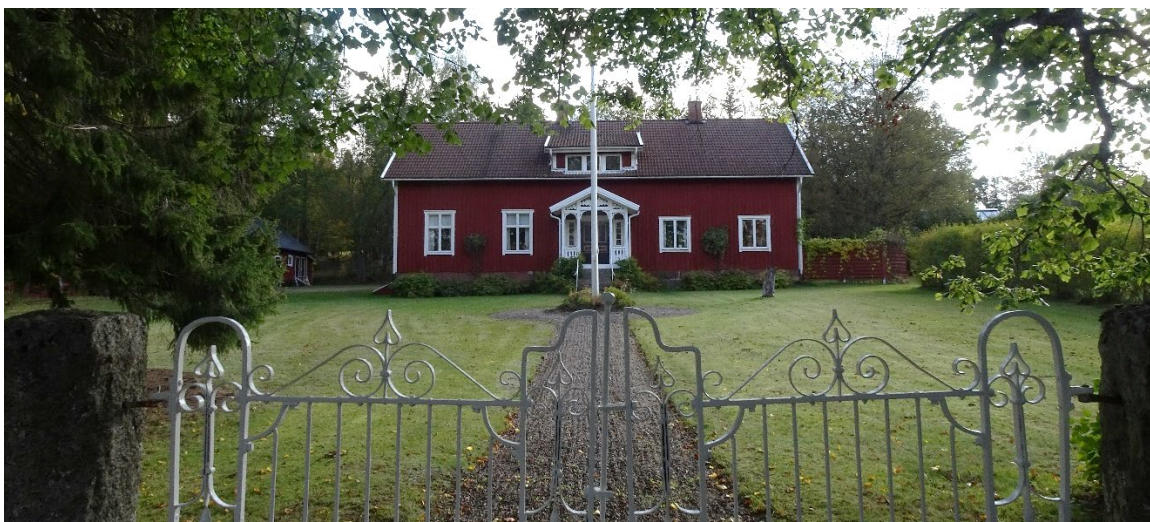
Havsjö 1:14, det nya skolhuset från 1911.

Fällhemmet 1 och 2 på Havsjö 1:26 och 1:27 utgör tillsammans en mindre lantbruksenhet. Ladugården på 1:26 byggdes 1879, bostadshuset uppfördes tidigare och även ladugården på 1:27. Idag har bebyggelsen på 1:26 flest bevarade element från denna tid med mangårdsbyggnadens volym, material och dess relation till de välbevarade uthusen. Åtgärder har gjorts över tid med byte av takmaterial till mörk plåt, en tillbyggnad på husets baksida men karaktären är välbevarad med äldre pardörrar och veranda med snickarglädje. Den intilliggande fastigheten är idag ombyggd och har ett antal nya byggnader intill den äldre bebyggelsen, men bidrar trots detta till en ökad förståelse för platsens historia. Haraldstorp är en välbevarad gårdsmiljö som tidigare låg under Havsjö säteri och finns nämnd i ägarlängder bak till 1600-talet. På gården ligger backstugan Björkholmen som flyttades till platsen tidigt 1900-tal, sädesmagasin, stensatt jordkällare, ladugård och ett timrat uthus med dubbla portar. På Havsjö 1:4, Havsjöbygget finns en bod med falufärgad locklistpanel och lunettfönster, den övriga bebyggelsen består av ett tegelbeklätt bostadshus från 1920, större ladugård och nya ekonomibyggnader.