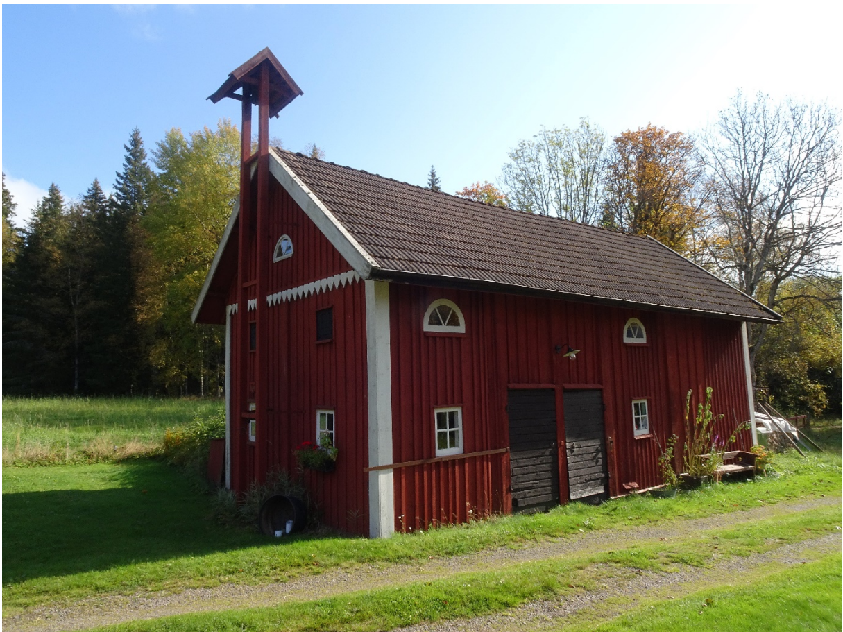
Havsjö 1:22 Humlahemmet.