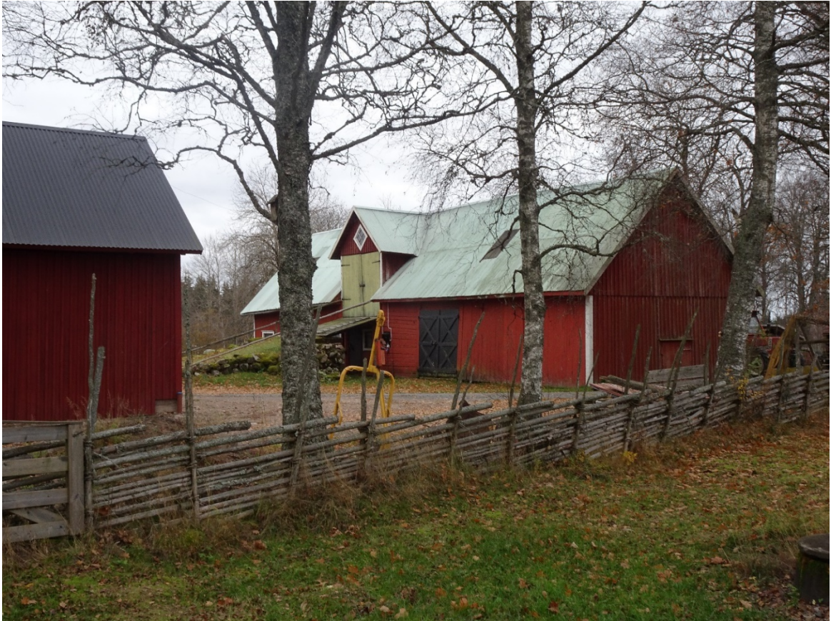
Ladugården på Fällhemmet 2, Havsjö 1:27.