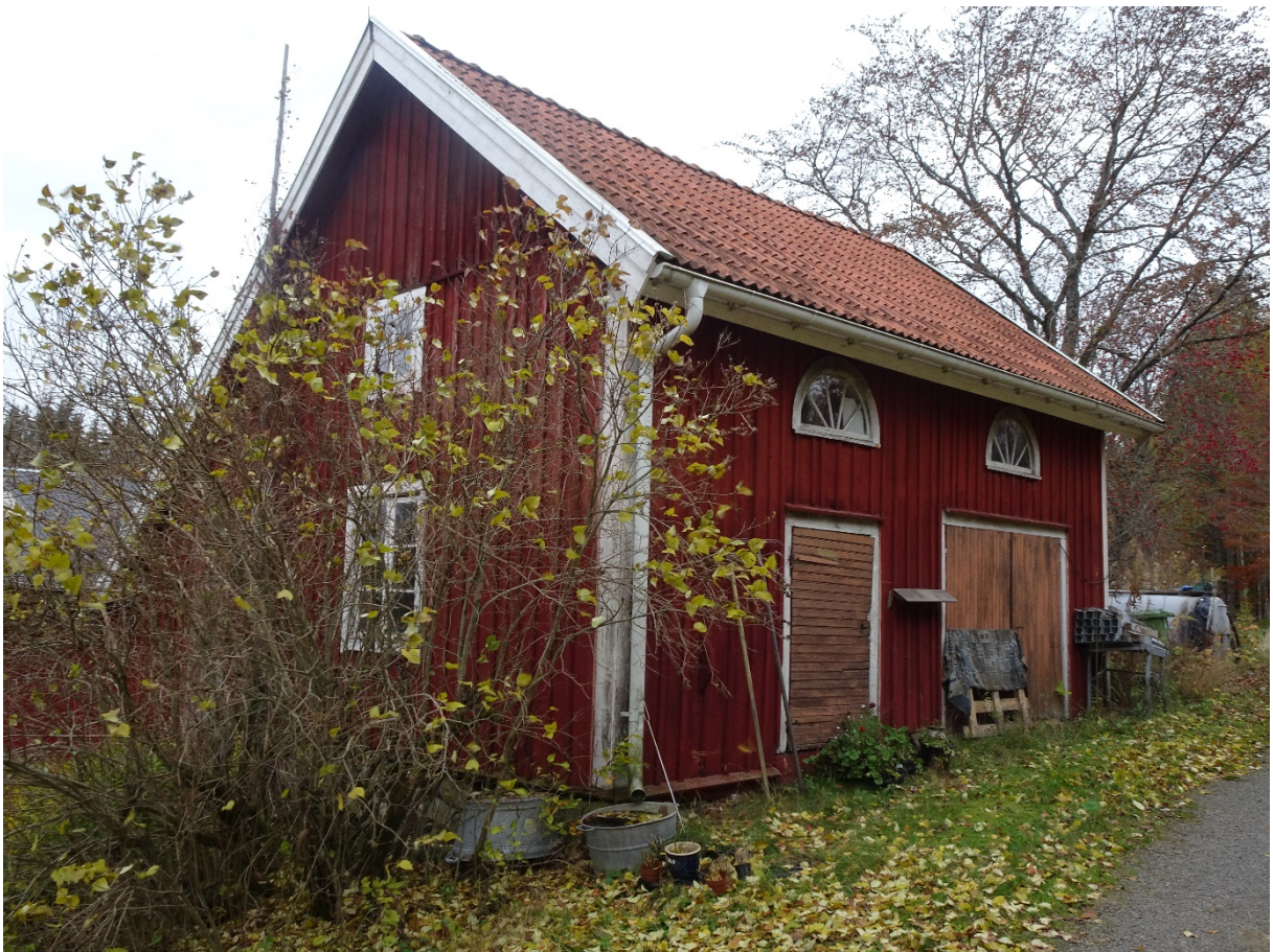
Havsjö 1:4, Havsjöbygget 1.