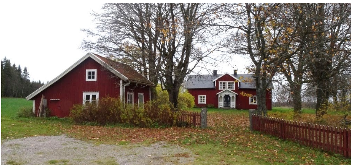
Fällhemmet 1, Havsjö 1:26.

Fällhemmet 1 och 2 på Havsjö 1:26 och 1:27 utgör tillsammans en mindre lantbruksenhet. Ladugården på 1:26 byggdes 1879, bostadshuset uppfördes tidigare och även ladugården på 1:27. Idag har bebyggelsen på 1:26 flest bevarade element från denna tid med mangårdsbyggnadens volym, material och dess relation till de välbevarade uthusen. Åtgärder har gjorts över tid med byte av takmaterial till mörk plåt, en tillbyggnad på husets baksida men karaktären är välbevarad med äldre pardörrar och veranda med snickarglädje. Den intilliggande fastigheten är idag ombyggd och har ett antal nya byggnader intill den äldre bebyggelsen, men bidrar trots detta till en ökad förståelse för platsens historia. Haraldstorp är en välbevarad gårdsmiljö som tidigare låg under Havsjö säteri och finns nämnd i ägarlängder bak till 1600-talet. På gården ligger backstugan Björkholmen som flyttades till platsen tidigt 1900-tal, sädesmagasin, stensatt jordkällare, ladugård och ett timrat uthus med dubbla portar. På Havsjö 1:4, Havsjöbygget finns en bod med falufärgad locklistpanel och lunettfönster, den övriga bebyggelsen består av ett tegelbeklätt bostadshus från 1920, större ladugård och nya ekonomibyggnader.