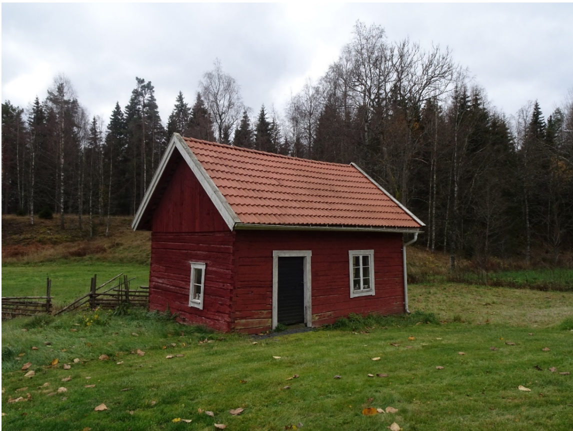
Haraldstorp 1:1, backstugan Björkholmen.