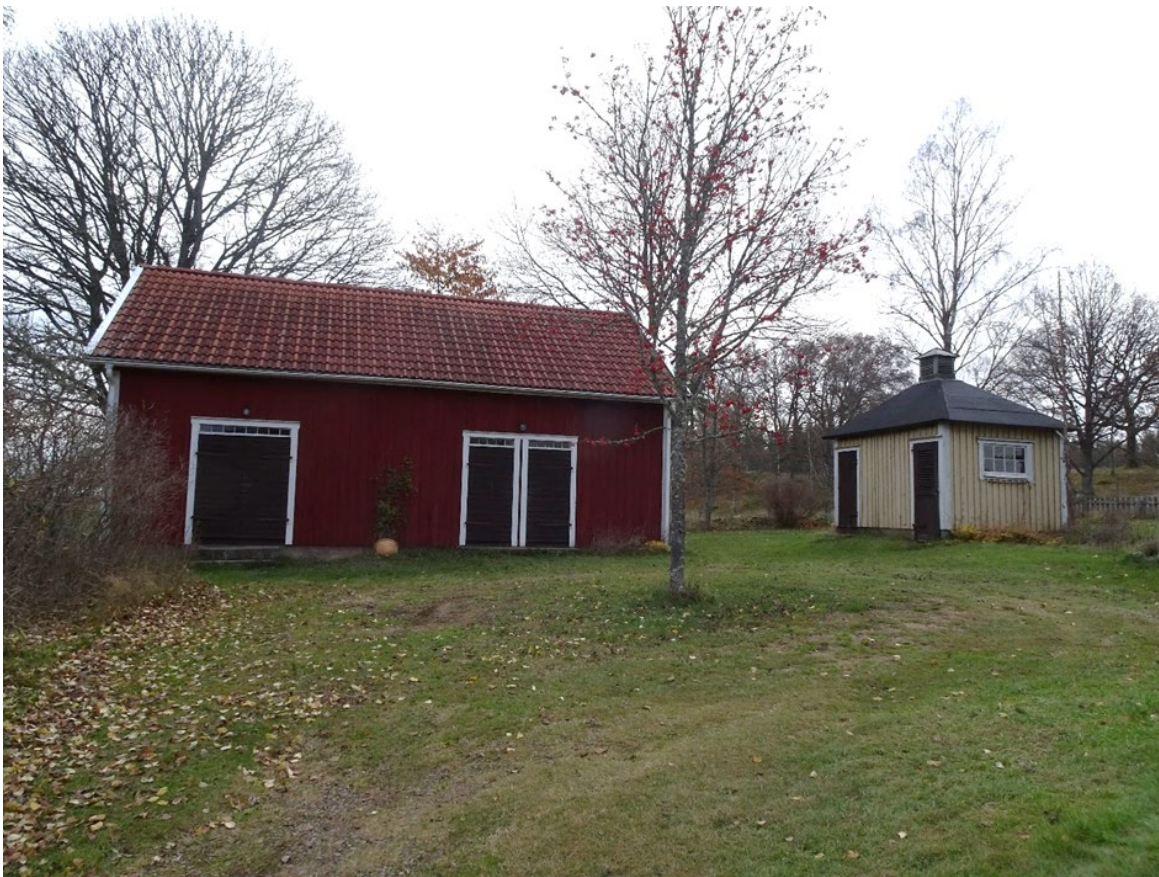
Havsjö 1:34, bod med äldre dörrar, överljus och utedass finns kvar på gården.