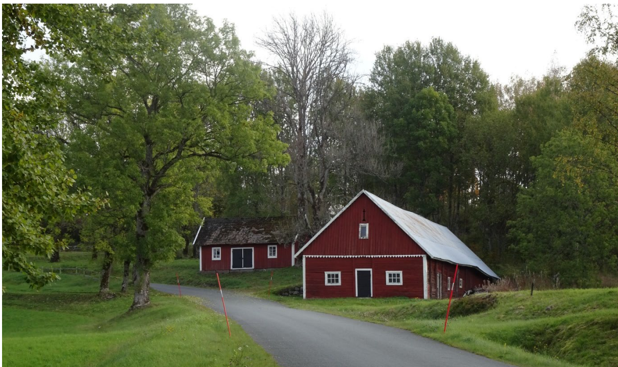
Byggnader på Havsjö 1:10.