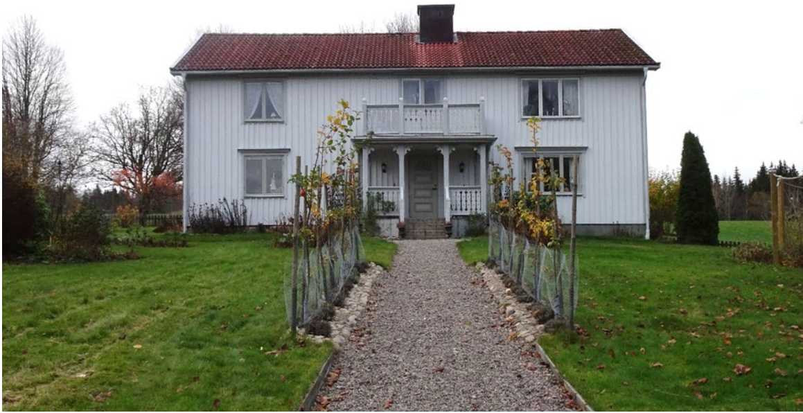
Havsjö 2, 1:34, uppfördes 1863 som en del av Havsjö by.